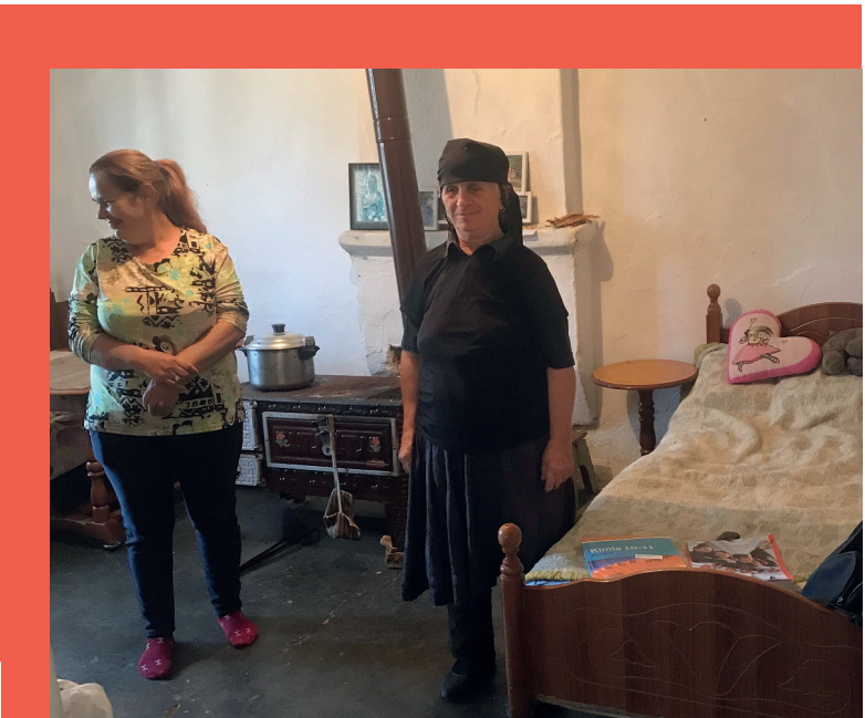
Hilfe ist zugesichert: Sie kommen raus aus ihrem einsturzgefährdeten Haus

Unser Partner vor Ort wird ebenfalls beim Bau mit anpacken. Eine Gemeinschaftsaktion, die Hoffnung gibt. Die das Lachen in die Gesichter der Kinder zaubert und Tränen in die Augen der Eltern und der Großmutter treibt – nur sind es dieses Mal keine Tränen der Verzweiflung, sondern Freudentränen. (Manfred Kräutler)